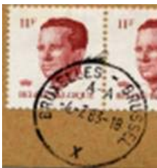
Tweetalig Brussel met voorrang Nederlands. Bestaat ook met voorrang Frans. Letter(s) onder de kantoornaam en onderaan de X.