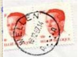
Postkantoor naam met onder letters dicht bij de gegroepeerde 7 puntjes