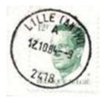
Kantoornaam daaronder letter en onderaan postnummer