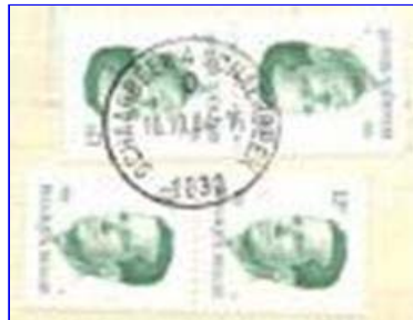
Tweetalig stempel met nummer tussen de kantoornamen en daaronder de letter Helemaal onder het postnummer