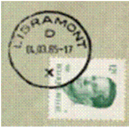
Kantoornaam met daaronder de letter. Onderaan de X

Stempels van sorteercentra zijn te herkennen aan de letter X in het stempel