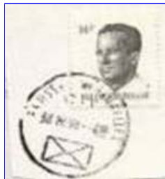
Tweetalig stempel van Brussel, met voorrang Nederlands, bestaat ook met voorrang Frans. Daaronder de letter(s) en onderaan het "enveloppe"