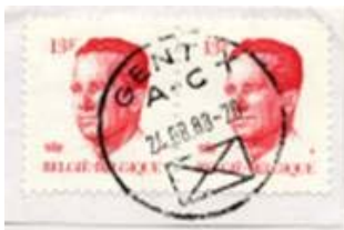
Kantoornaam met daar onder de letter(s) en onderaan een "enveloppe"