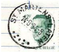
Postkantoor naam met onder 7 punten "plat" gespreid

De puntjes kunnen wijd uiteen staan of dicht opeen gegroepeerd zijn. Zij kunnen op een kluitje staan of "plat" gespreid zijn. De afstand tussen letters en puntjes kan variëren.