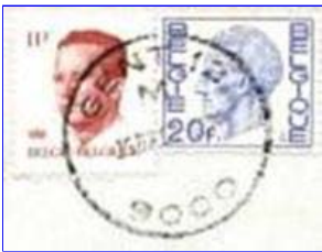
Het stempel van Gent 12 M 9000 heeft een grotere diameter (ca. 34mm).