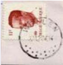
Postkantoor naam met onder 13 punten "plat" gespreid