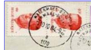
Tweetalige namen onder elkaar. Postnummer onderaan en letter daarboven