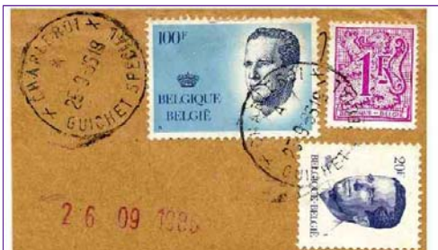
Kantoornaam tussen 2 X-en, daaronder letter. Brussel had de X tussen de 2-talige namen. Onder in Franstalig gebied Oostende X Speciaal Guichet Special. In Nederlands-talig gebied Speciaal loket. Alleen Brussel X ( rechts) had Speciaal Loket en Guichet Special onder elkaar