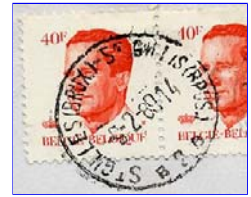
Kantoornaam in 2 talen, gescheiden door streepje. Onderaan nummer tussen 2 letters.