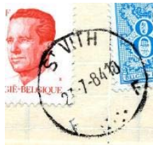
Postkantoor naam met onder letters ver af van de gegroepeerde 7 kleine puntjes

De puntjes kunnen wijd uiteen staan of dicht opeen gegroepeerd zijn. Zij kunnen op een kluitje staan of "plat" gespreid zijn. De afstand tussen letters en puntjes kan variëren.