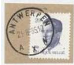
Kantoornaam met aan de onderkant X tussen 2 letters