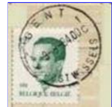
Gent 1 had een stempel met onderaan: "POSTWISSELS"