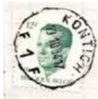
Kantoornaam met onder het kantoonummer tussen 2 letters. Rechts zelfde met kleine letters