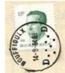
Postkantoor naam en onder 7 punten wijd gegroepeerd met aan weerszijde een letter

Klik hier om deze pagina's in A4 af te kunnen drukken