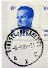
Tweetalig Brussel met voorrang Nederlands. Bestaat ook met voorrang Frans Onderaan X tussen twee letters