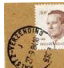
Aalst en St. Niklaas hebben een stempel met achter de kantoornaam: VERZENDING