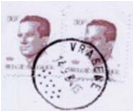
Postkantoor naam met onder 13 punten gegroepeerd