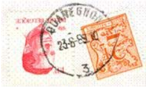
Kantoornaam met onderaan het kantoonummer