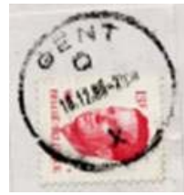
Gent Q X heeft een stempel met een grotere diameter