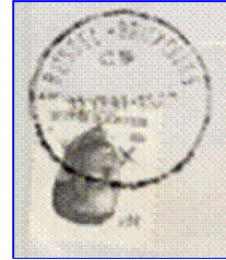
Evenals Brussel CS X (ca. 34mm)