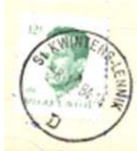
Kantoornaam met onder de dienstletter