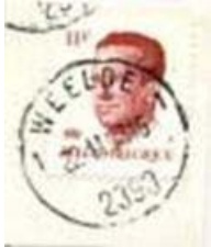
Kantoornaam tussen 2 nummers onderaan het postnummer.