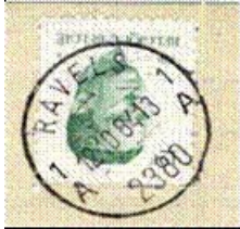
Kantoornaam tussen 2 nummers en onder het postnummer tussen 2 letters