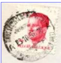
Links: BrusselXBruxelles. Aan weerszijde van de datum een letter.

Brussel X heeft een dependance in de luchthaven van Zaventem. Zegels, die daar gestempeld werden hadden de teksten; BrusselXLuchthaven en BruxellesX Aeroport of BruxellesX Aeroport en BrusselXLuchthaven