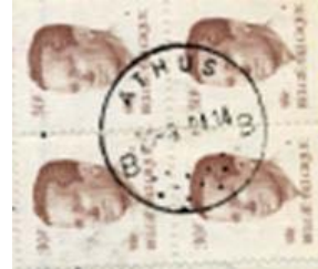
Postkantoor naam met onder 13 punten gegroepeerd en aan weerszijde een letter