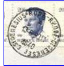
Kantoornaam in 2 talen, gescheiden door streepje, tussen 2 nummers. Daar onder letter en boven de nummers het postnummer