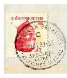
Dit stempel met BruxellesXBrussel met daaronder een letter en onderaan Speciaal Loket boven Guichet Special werd later door het type hieronder vervangen.