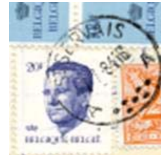
Postkantoor naam en onder 7 punten "plat" gegroepeerd met aan weerszijde een letter